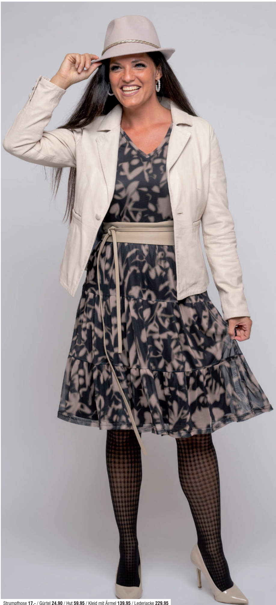
Strumpfhose 17,- / Gürtel 24,90 / Hut 59,95 / Kleid mit Ärmel 139,95 / Lederjacke 229,95