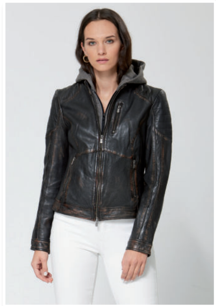
Lederjacke mit Jersey-Kapuze 179,95