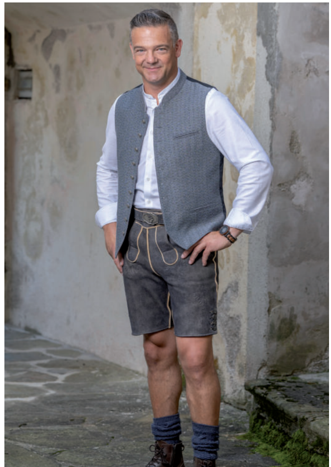
Tr. Stutzen 29,90 / Stehkragen-Hemd 69,90 / Tr. Gilet 199,90 / Lederne (Hirsch) 799,-