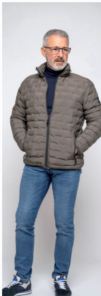
Jeans ab 69,95 / Rolli (BW) 89,95 / Steppjacke 159,95