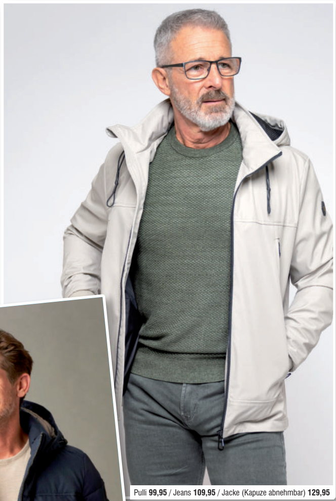
Pulli 99,95 / Jeans 109,95 / Jacke (Kapuze abnehmbar) 129,95