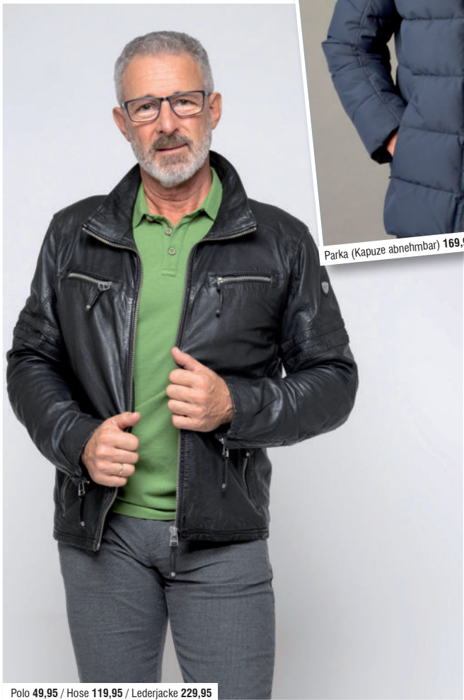
Polo 49,95 / Hose 119,95 / Lederjacke 229,95