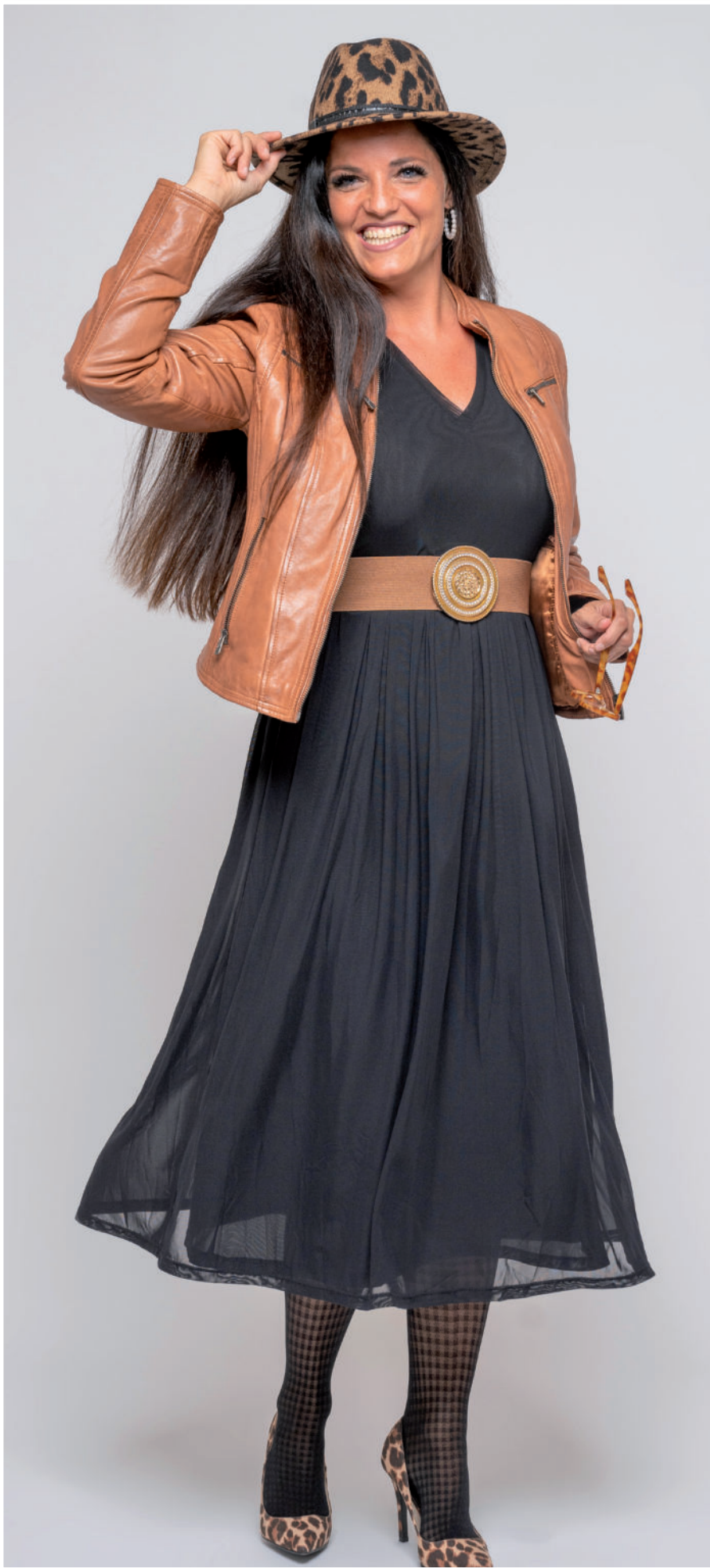
Strumpfhose 17,- / Gürtel 24,95 / Hut 69,95 / Kleid mit Ärmel 119,95 / Lederjacke 149,90