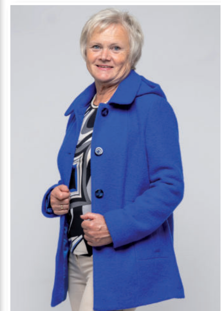
Shirt 55,95 / Jeans 99,95 / Walkjacke (Kapuze abnehmbar) 189,95