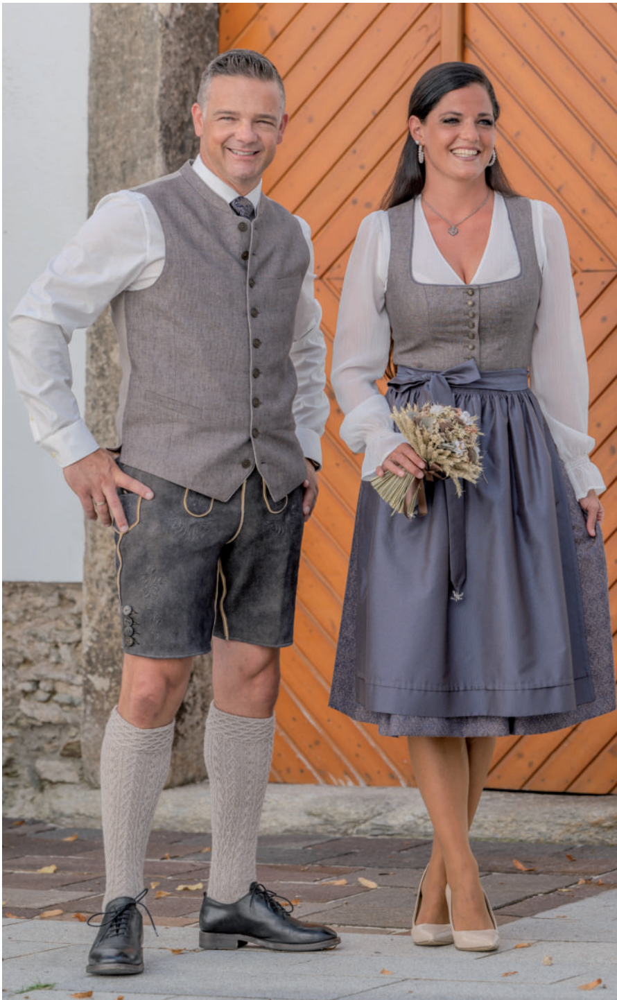
Tr. Gilet (Leinen mit Stoffrücken) 279,90 / Lederne (Hirsch) 799,-

„Unvergesslich heiraten in edler Tracht – ein Fest für Herz und Auge“