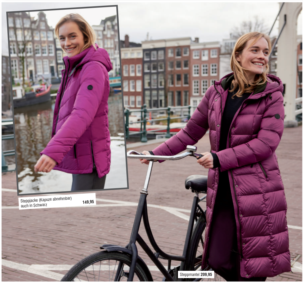
Steppjacke (Kapuze abnehmbar) auch in Schwarz 149,95