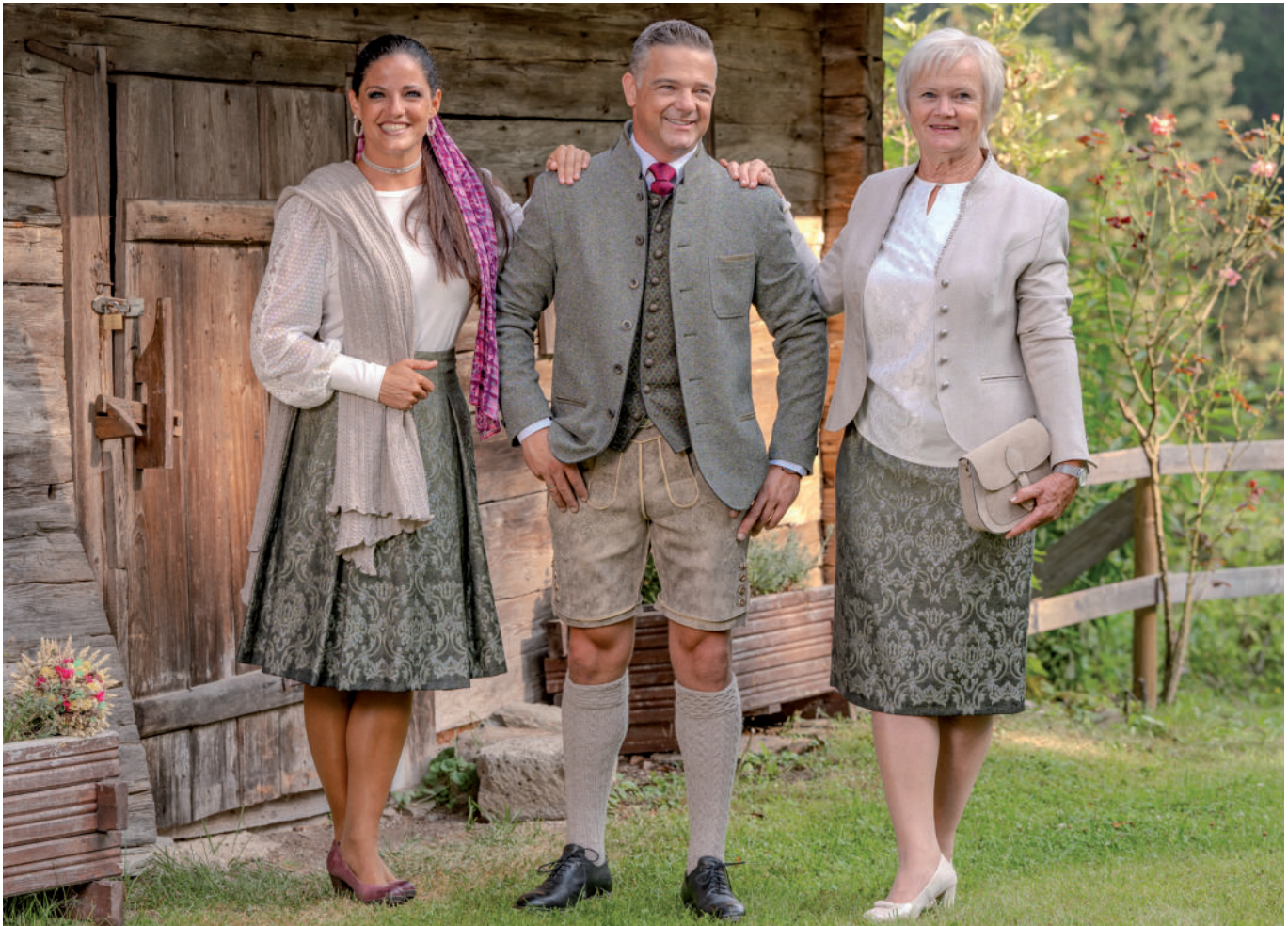
Schal 29,95 / Poncho 99,95 / Tr. Bluse (Stretch) 139,90 Tr. Rock (Brokat) 229,90