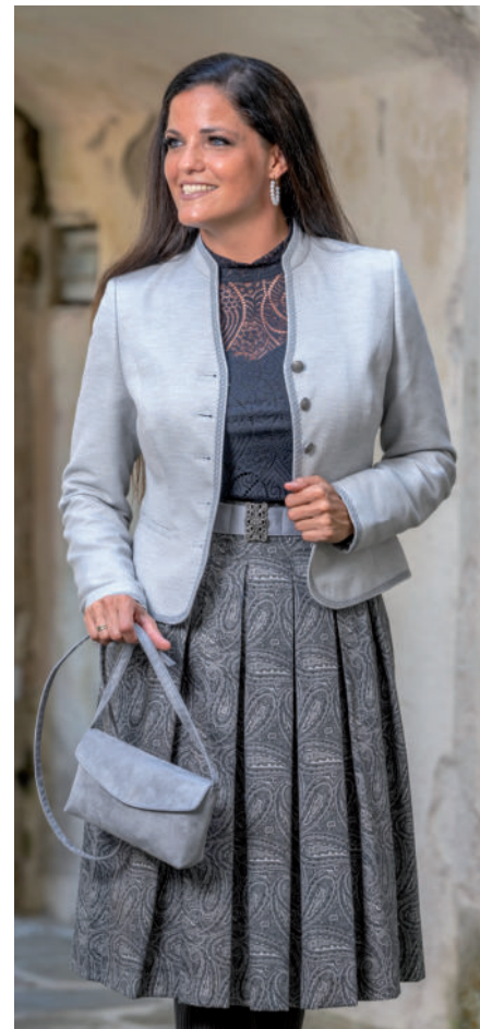
Tasche 49,95 / Tr. Spitzenbluse (Stretch) 119,90 / Tr. Rock 199,90 Tr. Jacke 329,-