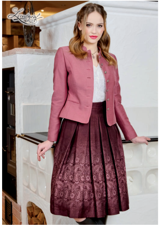
Tr. Rock (Brokat) 239,90 / Tr. Jacke 379,-