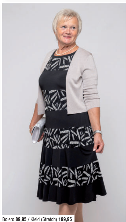
Bolero 89,95 / Kleid (Stretch) 199,95