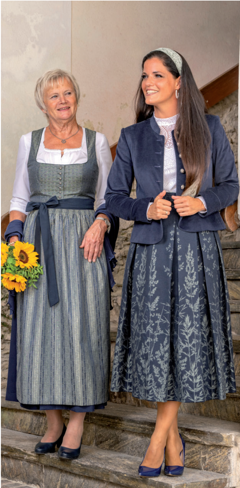
Di. Bluse mit Jersey-Rückenteil 99,90 / festl. Dirndl 339,-

„Stilvoll in Salbei und Blau – Tradition trifft Eleganz.“