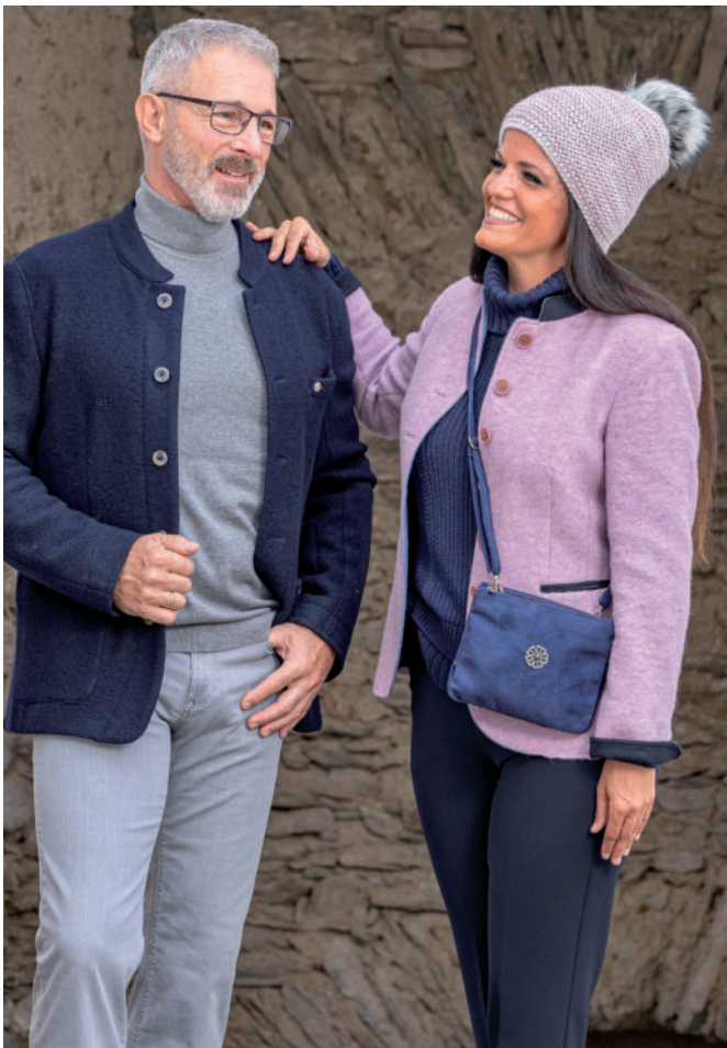
Jeans ab 69,95 / Rolli (BW) 89,95 Tr. Walkjanker 369,-