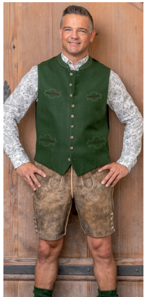
Tr. Hemd 99,90 / orig. Ausseer-Gilet 239,90 / Lederne (Hirsch) 779,-