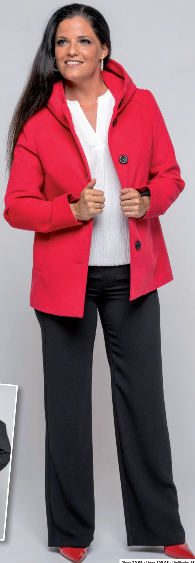
Bluse 79,95 / Hose 109,95 / Wolljacke 169,95

„Die Farbe Rot verleiht jedem Outfit besondere Eleganz und ist garantiert ein Hingucker.“