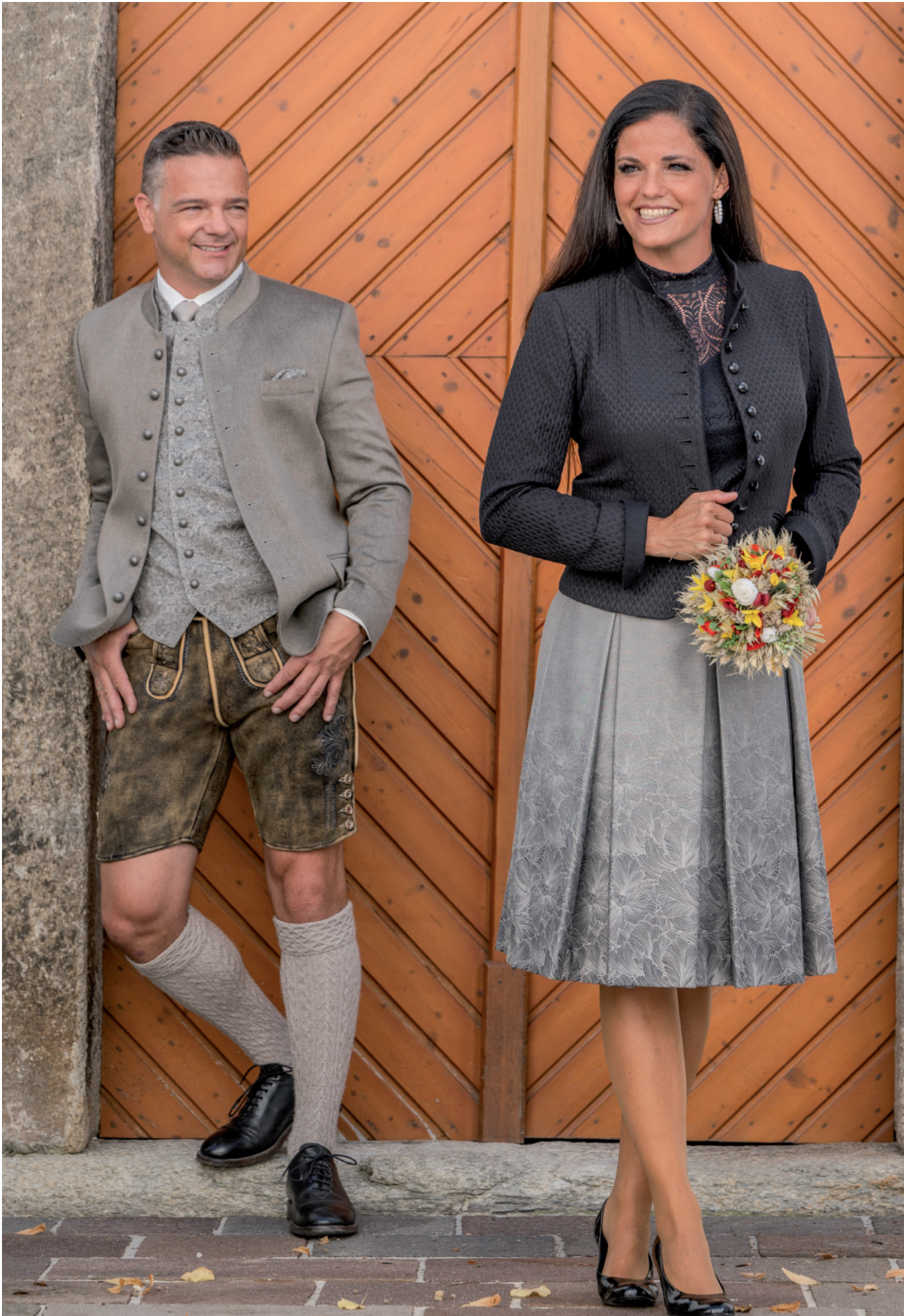
Hemd 59,90 / Tr. Stutzen (Handstrick) 99,95 / Tr. Gilet (Brokat) 189,90 / Tr. Janker (Stretch) 349,- / Lederne (Hirsch) 879,-