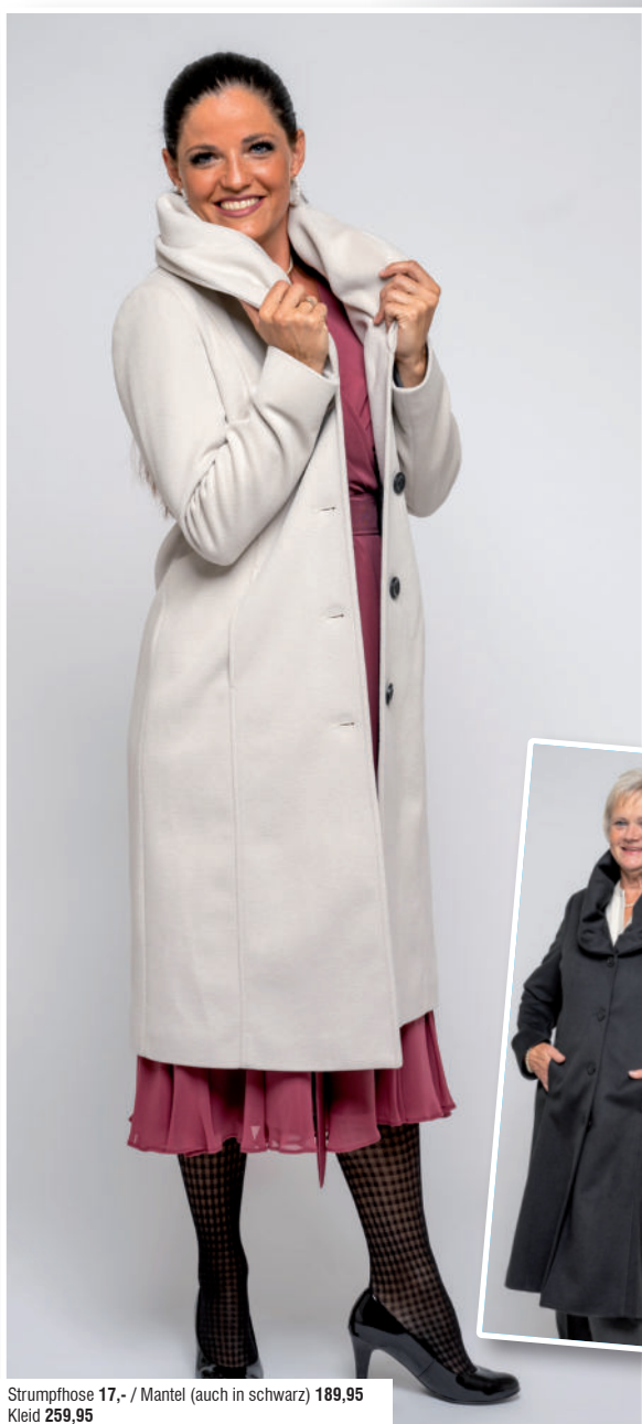
Strumpfhose 17,- / Mantel (auch in schwarz) 189,95 Kleid 259,95