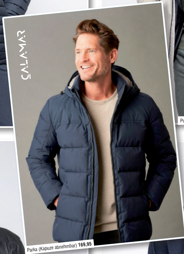
Parka (Kapuze abnehmbar) 169,95