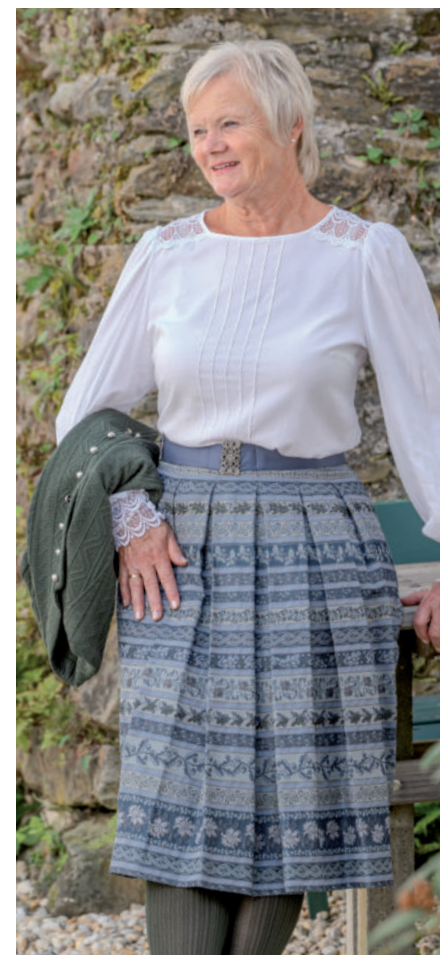
Tr. Bluse 119,90 / Tr. Rock (Brokat) 249,90 Tr. Jacke (Stretch) 249,90