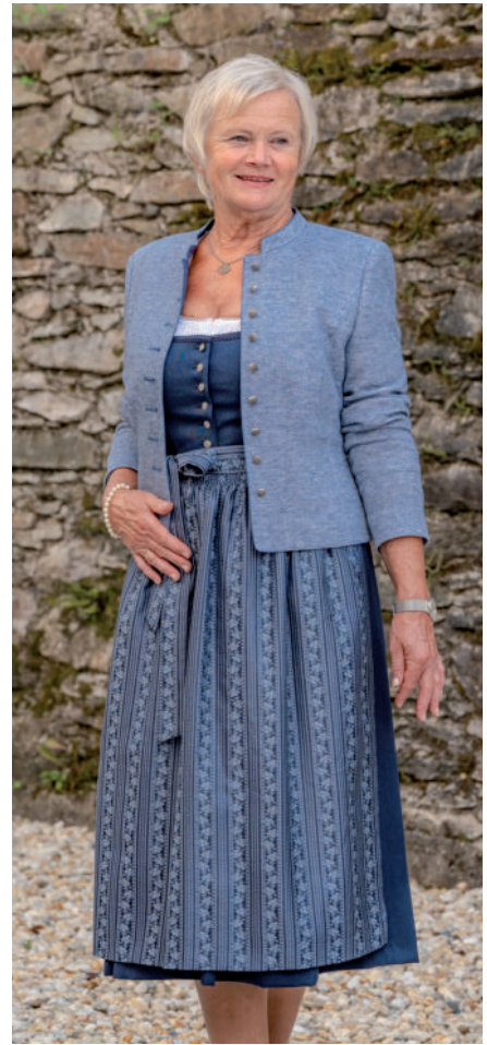
festl. Dirndl 279,90 / Tr. Jacke (Stretch) 299,90