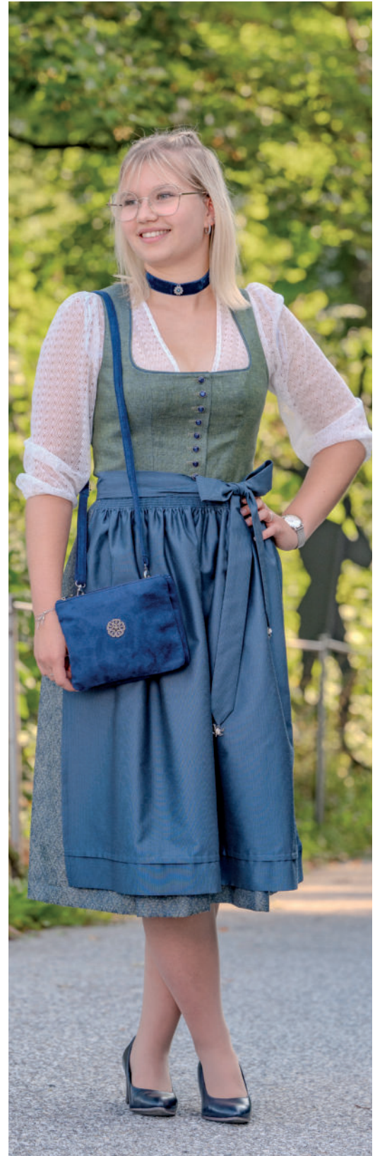
Kropfband 24,95 / Tasche 49,95 / Di. Bluse 89,90 / exkl. Dirndl 459,-