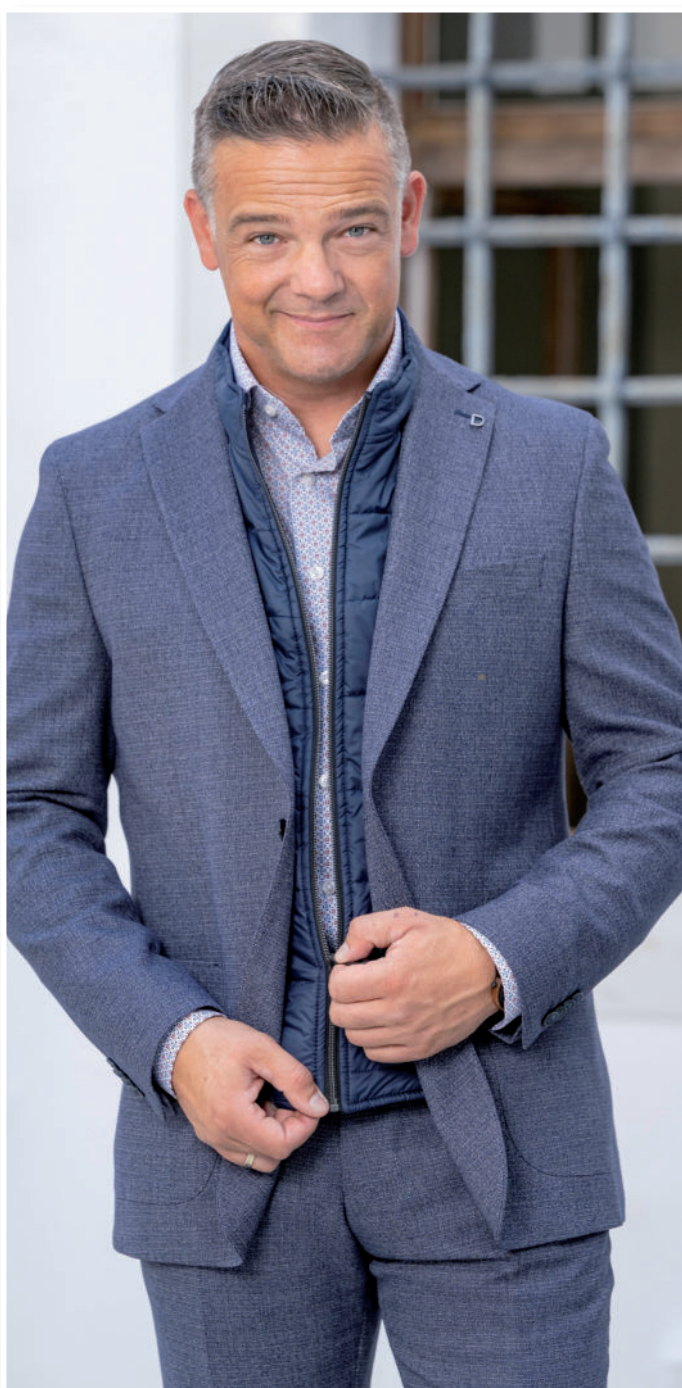
Hemd 69,90 / Hose 109,95 / Stretch-Sakko (Stepeinsatz abnehmbar) 269,95

„Der Hosenanzug – ein Must-Have. Ob frech, chic oder klassisch – immer gut gekleidet!“