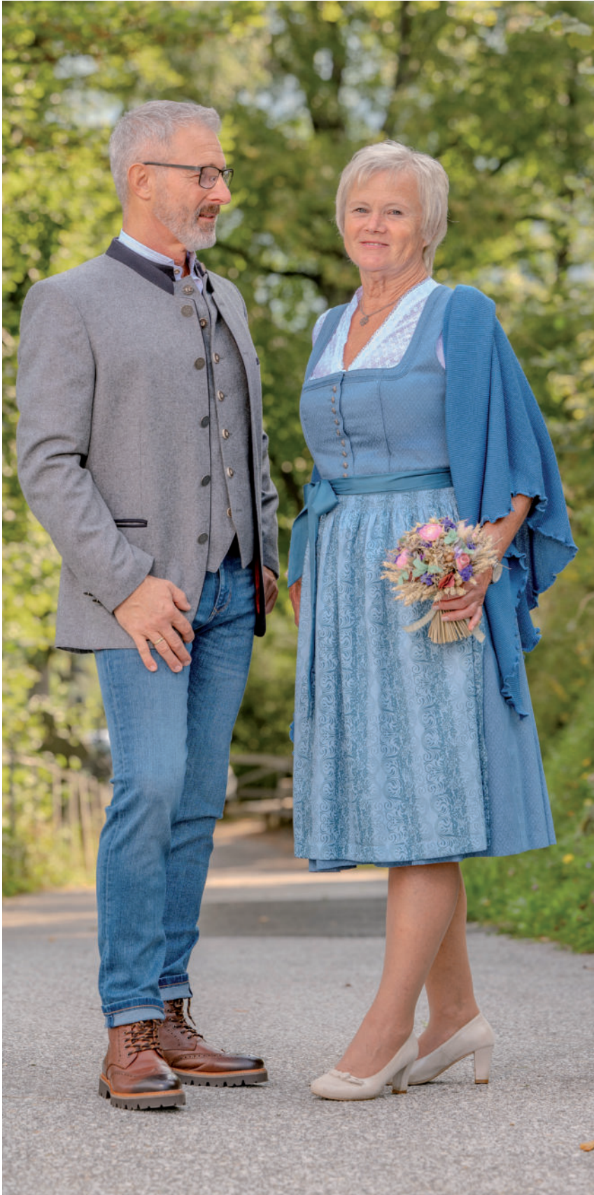
Tr. Stehkragen-Hemd 89,90 / Jeans 89,95 / Boots (Leder) 169,95 Tr. Gilet (Loden) 219,90 / Tr. Janker (Loden) 349,-

„Lieblingsstücke in Blau und Grau – Stretch und Loden vereinen Stil und Komfort.“