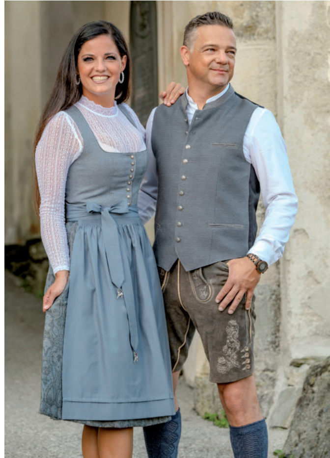
Di. Bluse (Stretch) 79,90 / Dirndl 439,- Stehkragen-Hemd 69,90 / Tr. Gilet 189,90 / Lederne (Wildbock) 529,-