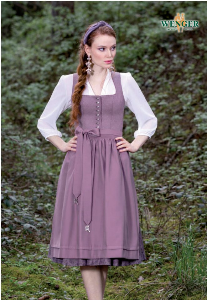
exkl. Dirndl 449,-

„Beerentöne, Rost und edles Grau – Trachtenrock, Dirndl und Hirschlederhose perfekt kombiniert.“