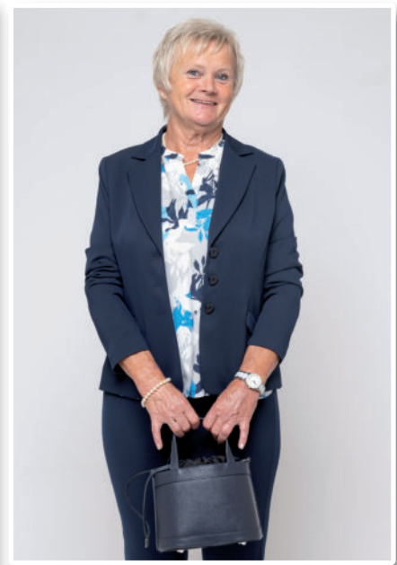
Tasche (Leder) 69,95 / Bluse 79,95 / Hose 99,95 / Blazer 179,95