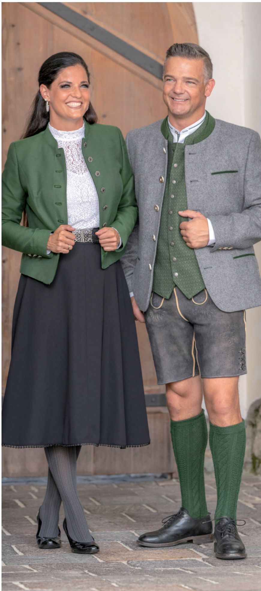
Strumpfhose 17,- / Tr. Spitzenbluse (Stretch) 119,90 Tr. Rock 179,90 / Tr. Jacke 379,-