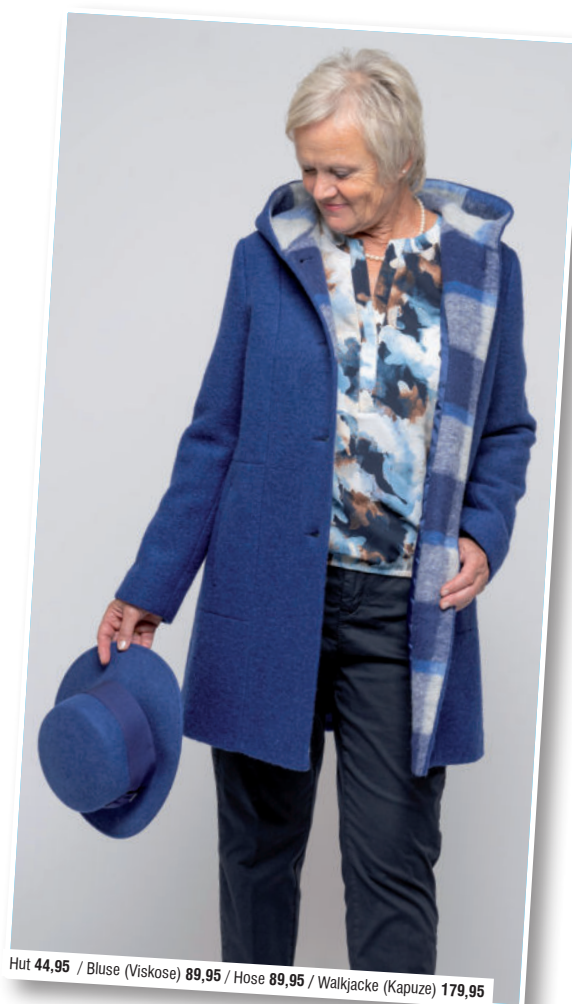
Hut 44,95 / Bluse (Viskose) 89,95 / Hose 89,95 / Walkjacke (Kapuze) 179,95