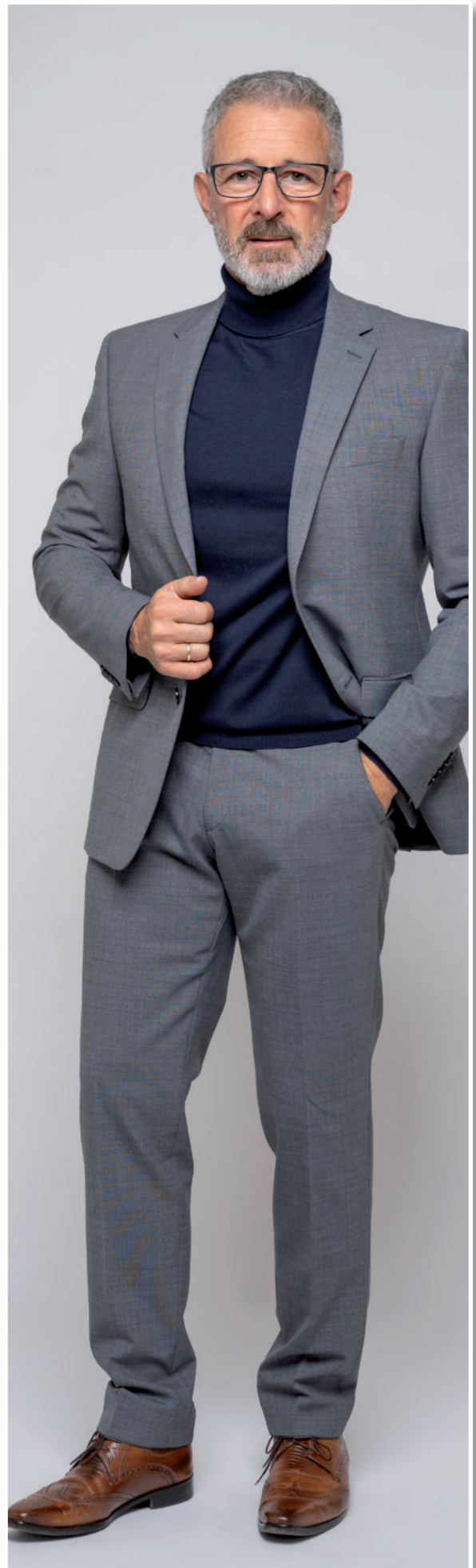
Rolli (BW) 89,95 / Hose 129,95 / Sakko 249,95