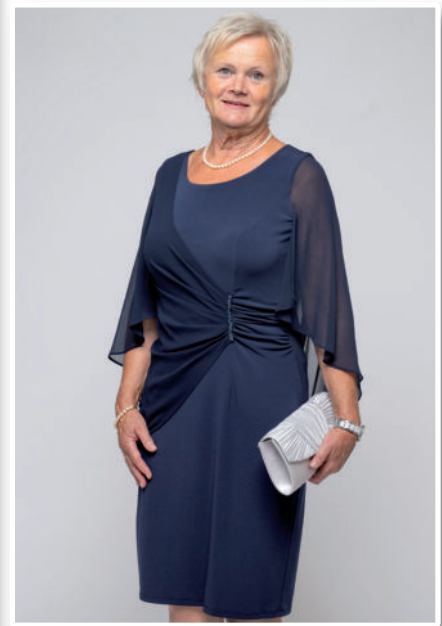
Tasche 49,95 / Kleid 239,95