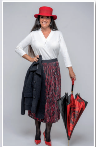
Hut 44,95 / Blusen-Shirt 69,95 / Rock 79,95 / Jacke 79,95