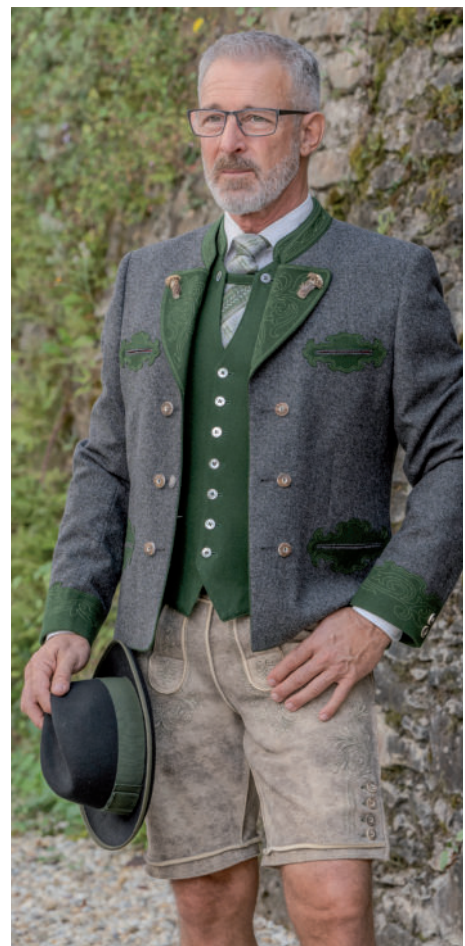
orig. Ausseer-Hut 99,95 / orig. Ausseer-Gilet 239,90 orig. Ausseer-Gamsfackl (Stretch) 479,- / Ausseer-Lederne 539,-