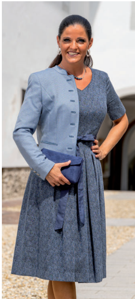
Tasche 49,95 / Kleid mit Ärmel (Stretch) 319,- Tr. Jacke 379,-