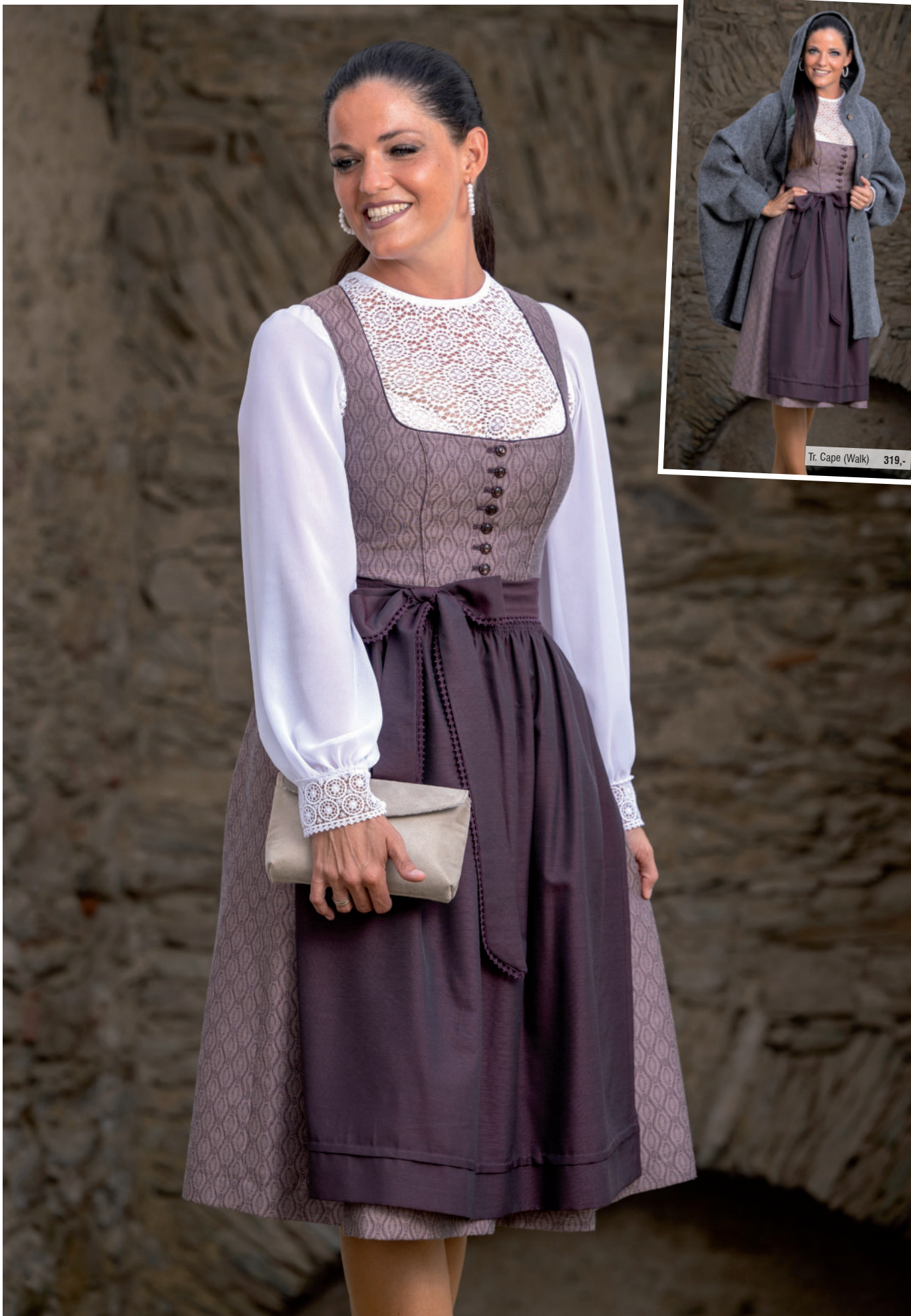
Tr. Cape (Walk) 319,-

Tasche 49,95 / Di. Bluse 99,90 / exkl. Dirndl 449,-