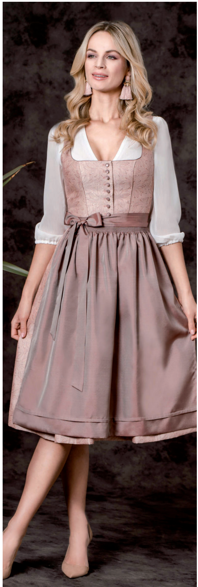
exkl. Dirndl (Brokat) 399,-