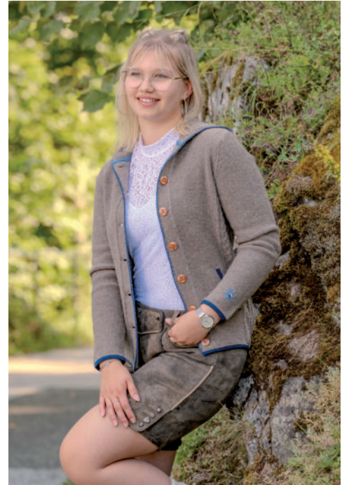
Tr. Spitzen-Body (Stretch) 99,90 / Tr. Weste 179,90 Lederne (Wildbock) 179,90