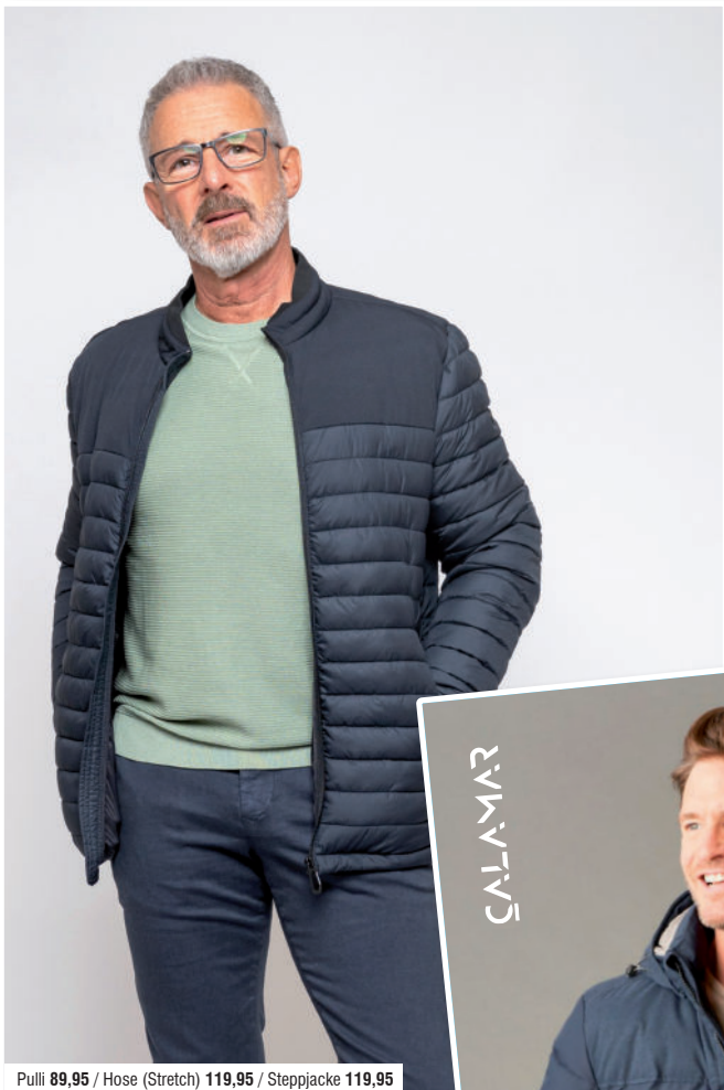
Pulli 89,95 / Hose (Stretch) 119,95 / Steppjacke 119,95