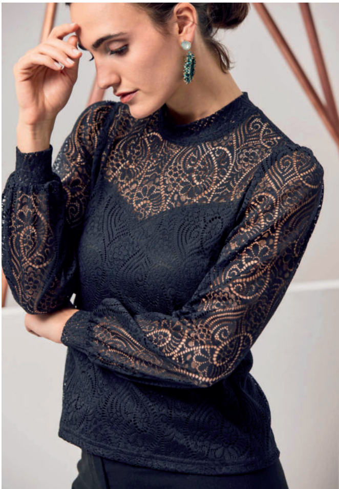
Tr. Spitzenbluse (Stretch) 119,90