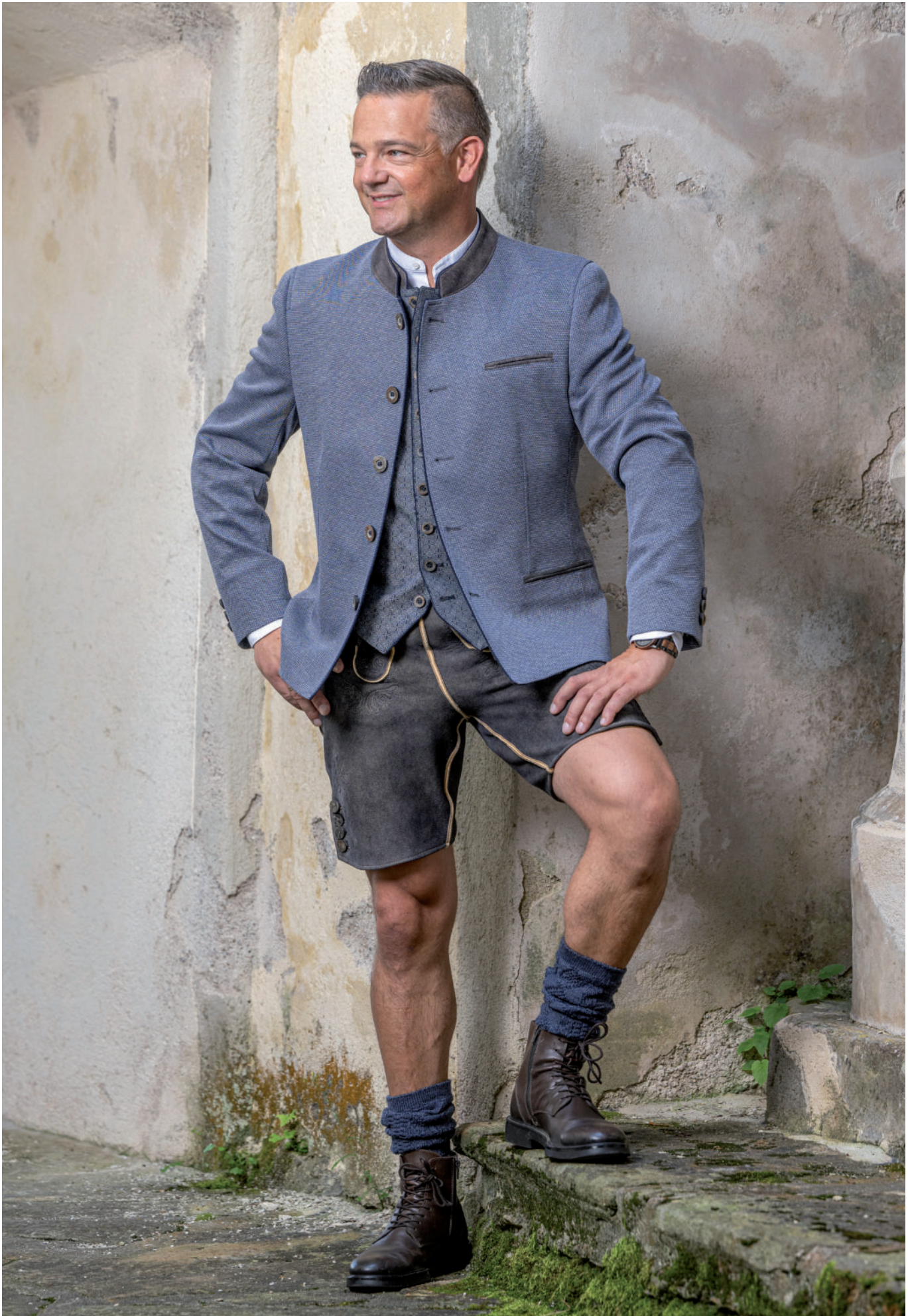
Stutzen 29,90 / Steh-Kragenhemd 69,90 / Tr. Gilet 199,90 / Tr. Janker (Jersey) 319,- / Lederne (Hirsch) 799,-