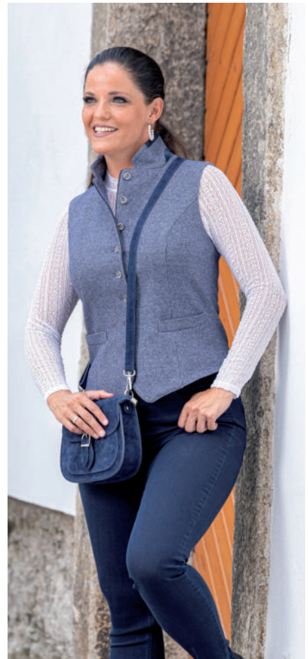
Tasche 49,95 / Tr. Bluse 79,90 / Jeans 99,90 Tr. Gilet (Jersey) 219,90