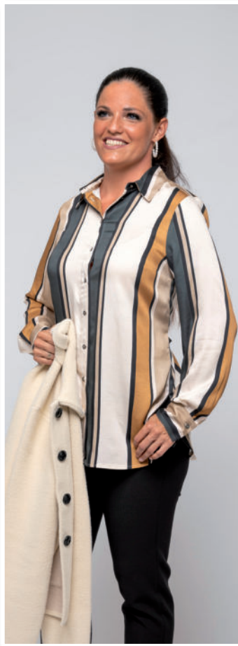
Bluse (Viskose) 79,95 / Jacke 79,95 / Hose 99,95