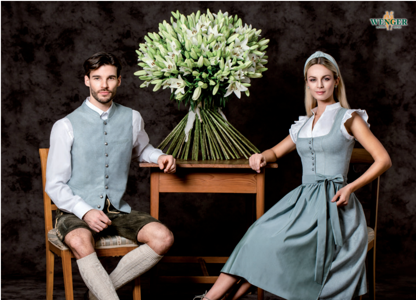
Tr. Gilet (Brokat) 249,90