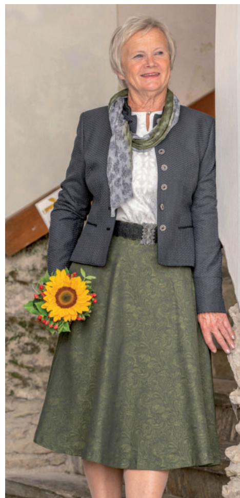
Schal 49,90 (Viskose) / Tr. Bluse 69,90 / Tr. Rock (Brokat) 249,90 Tr. Jacke (Stretch) 389,-

„Erleben Sie traditionelle Tracht neu interpretiert – von individuell wandelbarer Lederhose bis zum neuen Blumenstraßen-Dirndl, für unvergessliche Momente.“