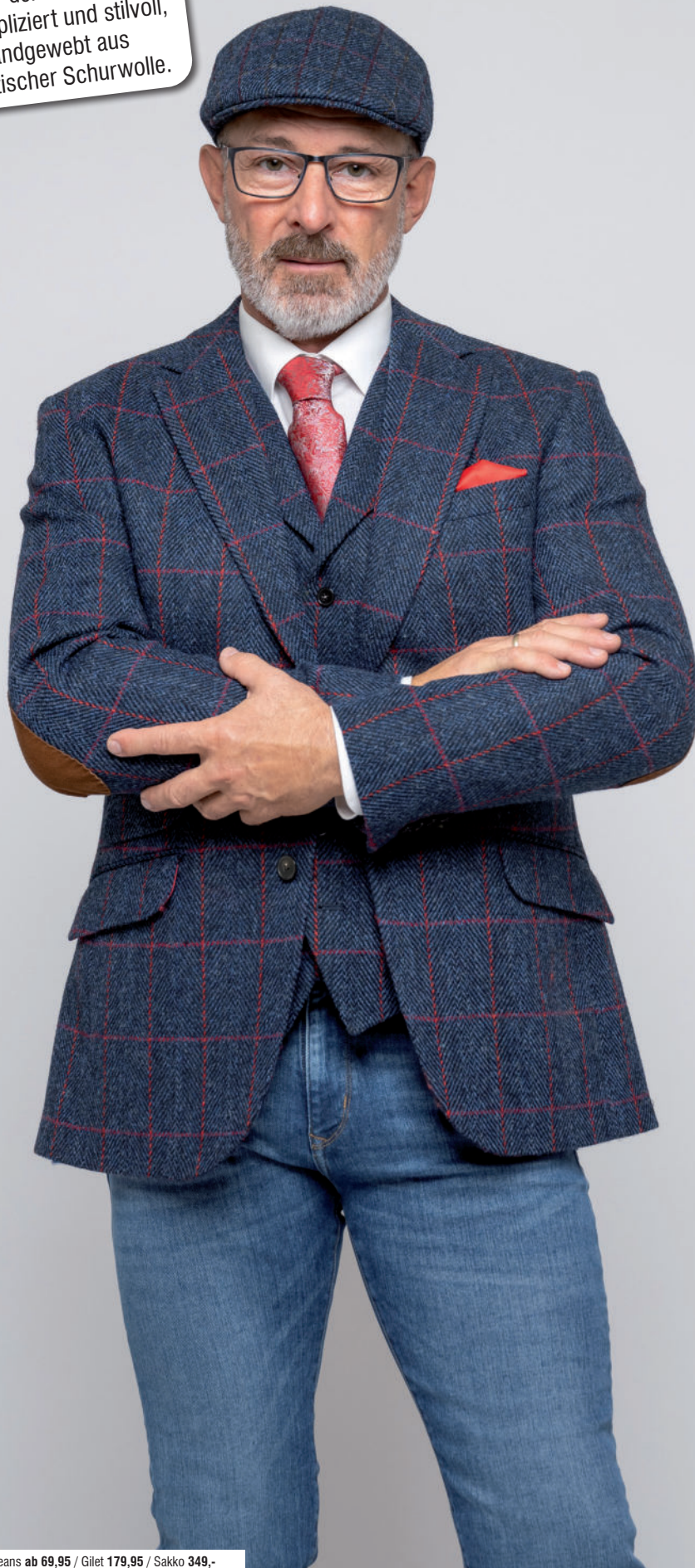
Kappe 59,95 / Jeans ab 69,95 / Gilet 179,95 / Sakko 349,-

Der Harris-Tweed Look für den Mann – unkompliziert und stilvoll, handgewebt aus schottischer Schurwolle.