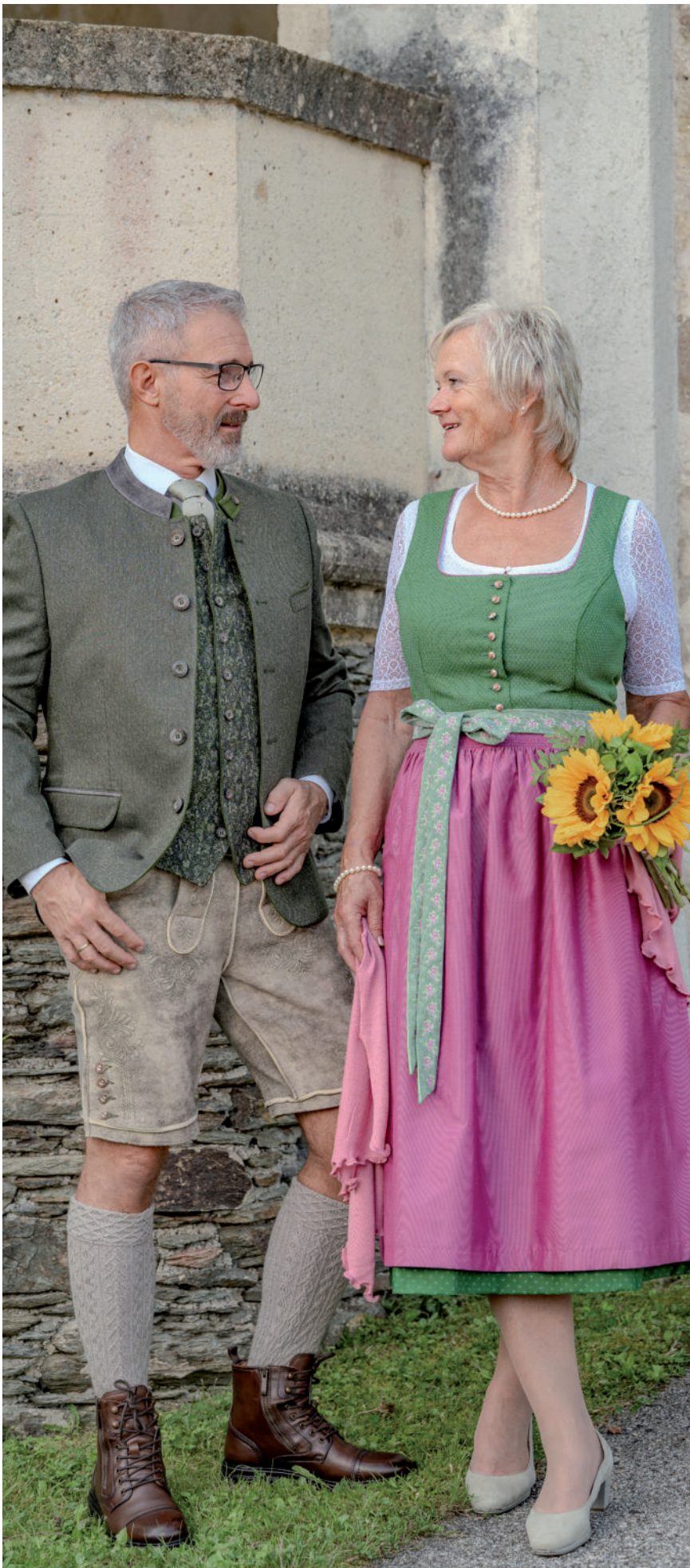
Hemd 59,90 / Tr. Gilet 189,90 / Tr. Janker (Stretch) 349,- Ausseer-Lederne (Wildbock) 539,-