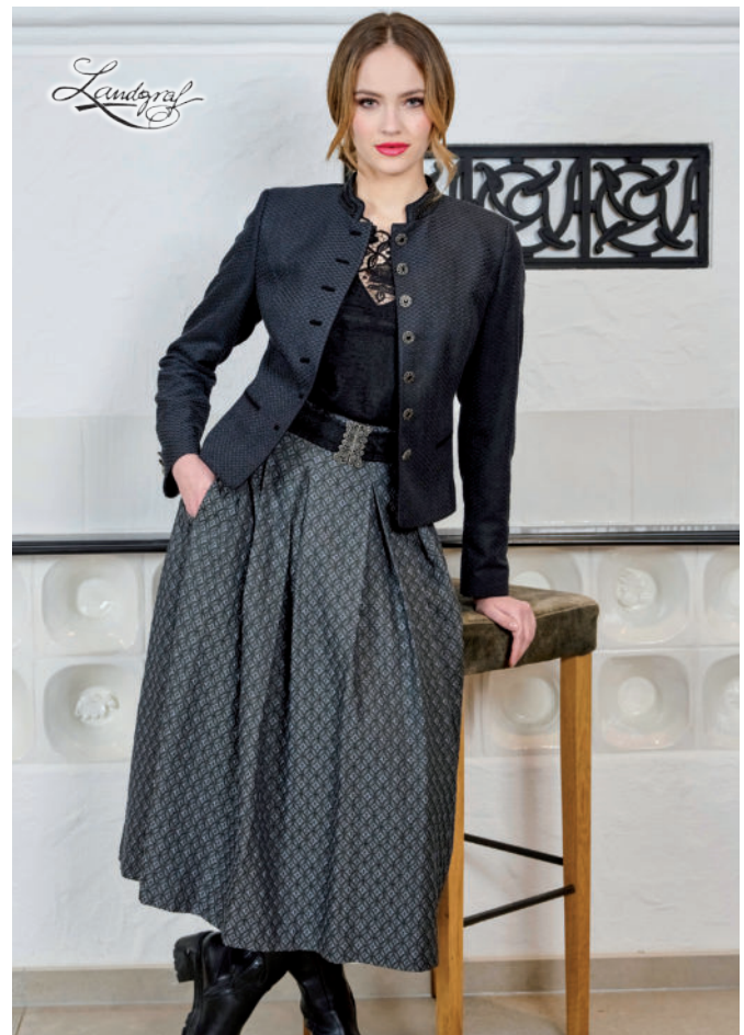
Tr. Rock 239,90 / Tr. Jacke (Stretch) 389,-

„Trendfarben der Saison: Edles Schwarz für Trachtenrock, Dirndl und Trachtenjacke, ergänzt durch elegante Olivgrüntöne.“