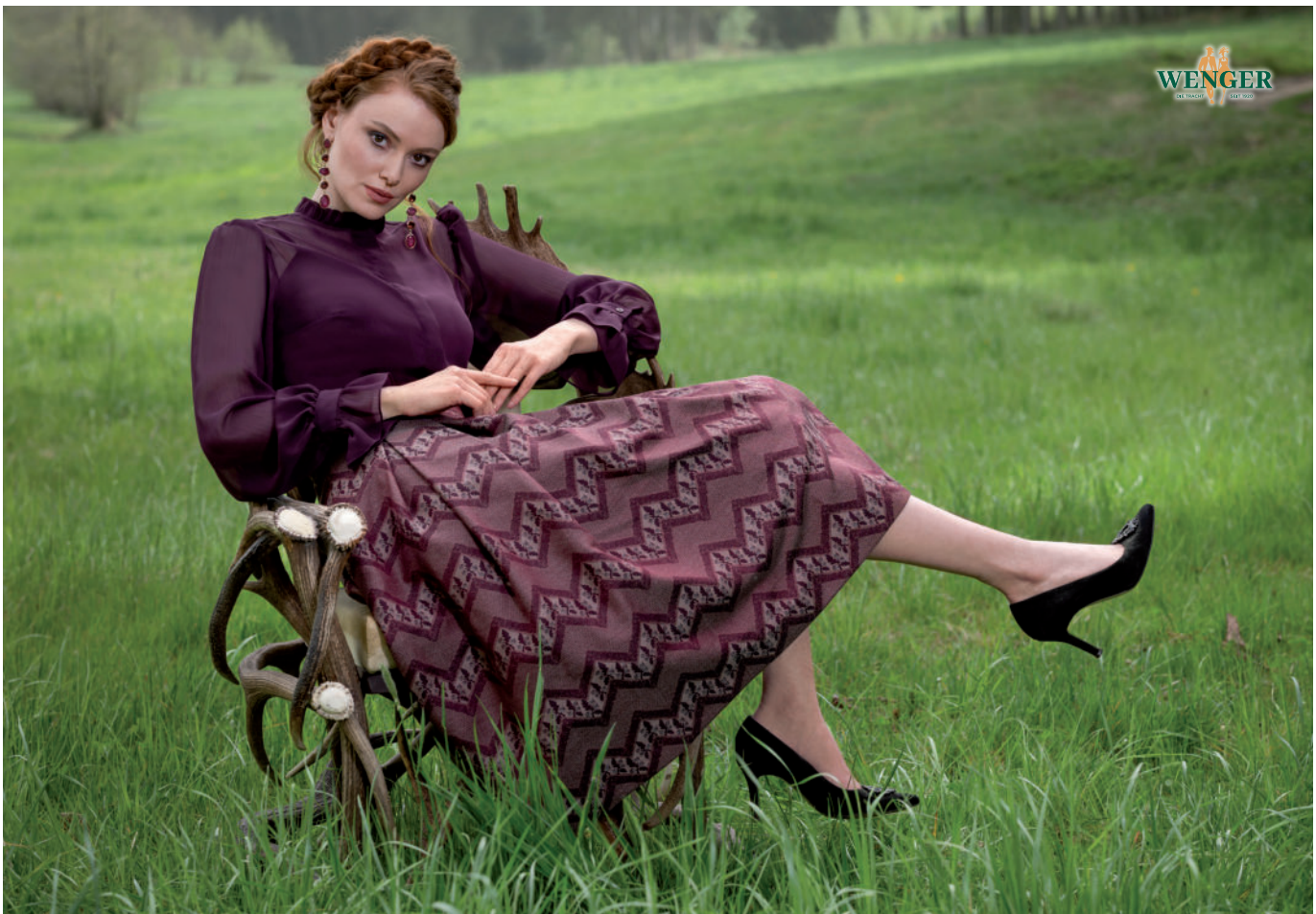
Tr. Bluse (auch in Blau und Creme) 139,90 / Tr. Rock (Brosat) 269,90

„Beerentöne, Rost und edles Grau – Trachtenrock, Dirndl und Hirschlederhose perfekt kombiniert.“