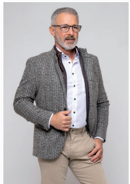
Hemd 69,90 / Hose 119,95 Jersey-Sakko (Steppensatz abnehmbar) 319,95