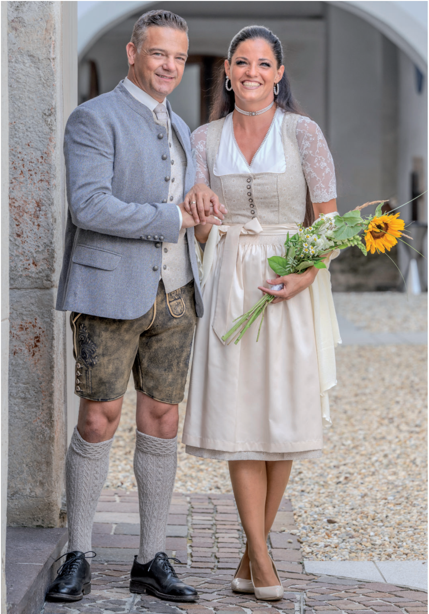
Tr. Stutzen (Handstrick) 99,95 / Tr. Janker (Stretch) 349,- / Tr. Gilet (Brokat) 219,90 / Lederne (Hirsch) 879,-