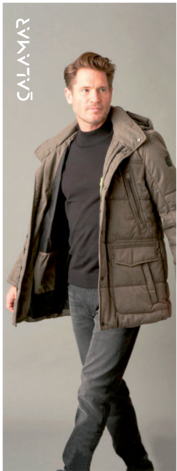
Jeans ab 69,95 / Parka 189,95