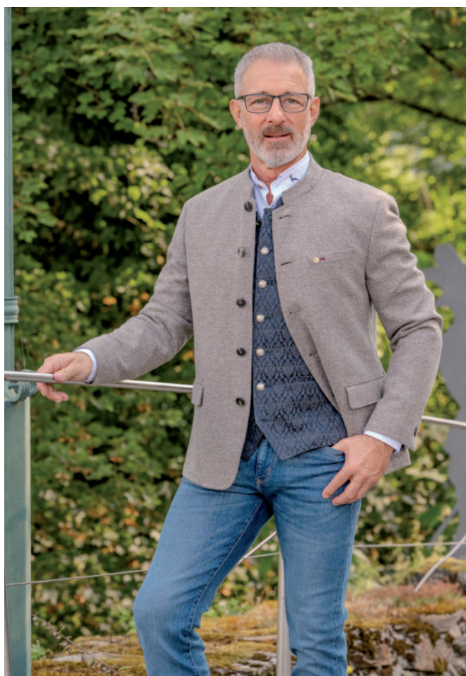
Jeans ab 69,95 / Tr. Stehkragen-Hemd 99,90 / Tr. Gilet 239,90 / Tr. Janker (Jersey) 339,-