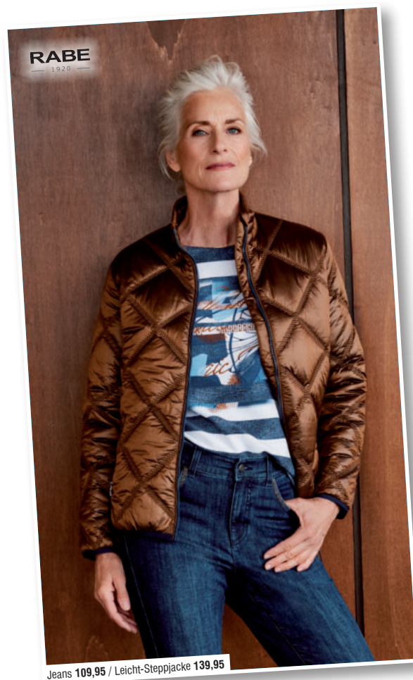
Jeans 109,95 / Leicht-Steppjacke 139,95