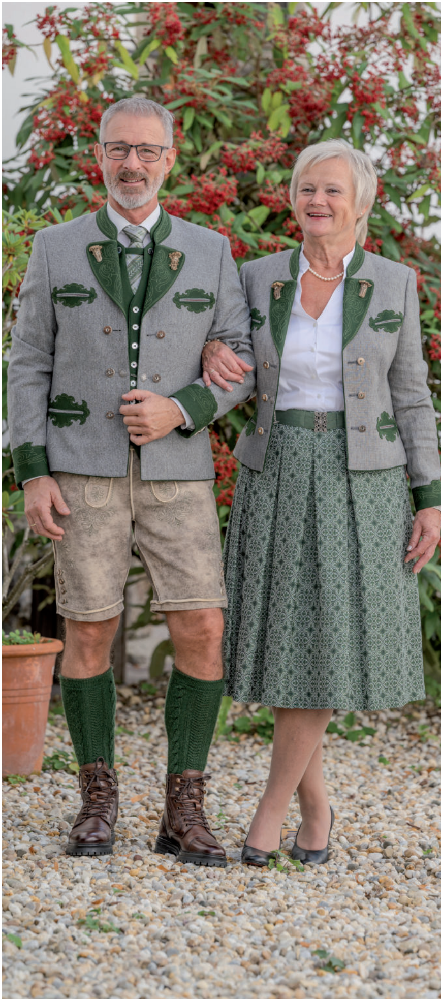
Krawatte 49,95 / orig. Ausseer-Gilet 239,90 orig. Ausseer-Gamsfrackl (Loden) 499,- / Ausseer-Lederne 539,-