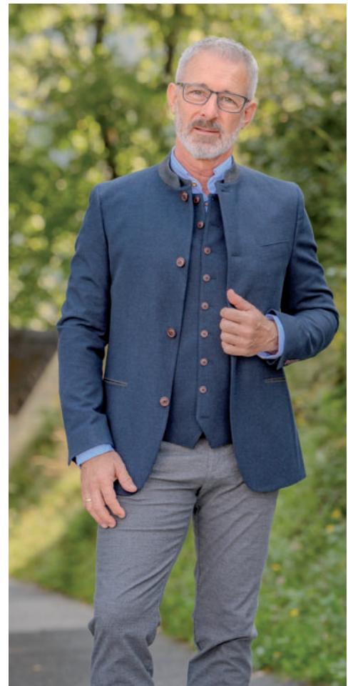
Tr. Stehkragen-Hemd 89,90 / Hose 119,95 / Tr. Gilet (Stretch) 139,95 Tr. Janker (Stretch) 249,95