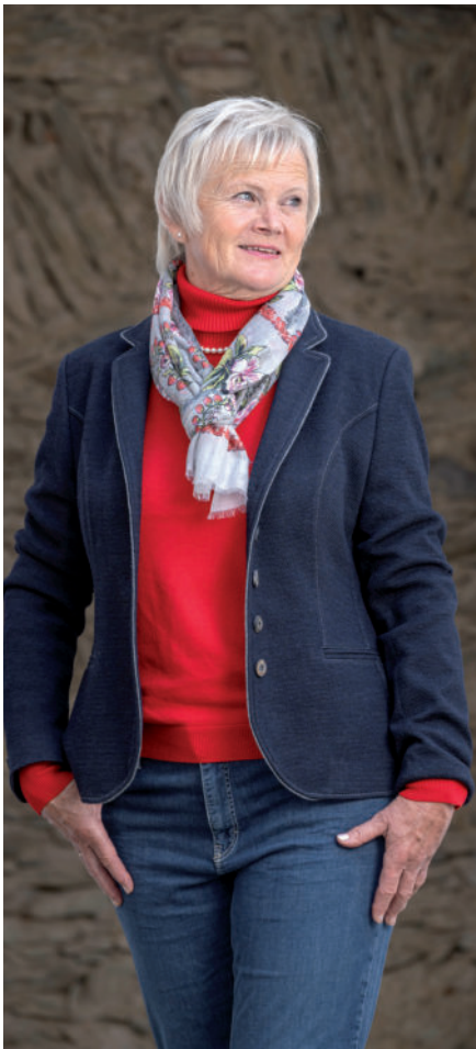
Schal (Seide/Viskose) 59,90 / Rolli (auch in Weiß) 79,95 Jeans 89,95 / Tr. Jacke (Jersey) 339,-