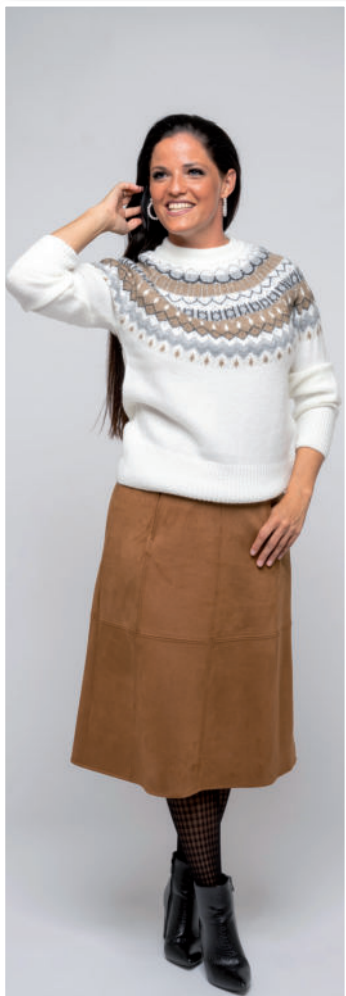
Strumpfhose 17,- / Pulli 59,95 / Rock 99,95