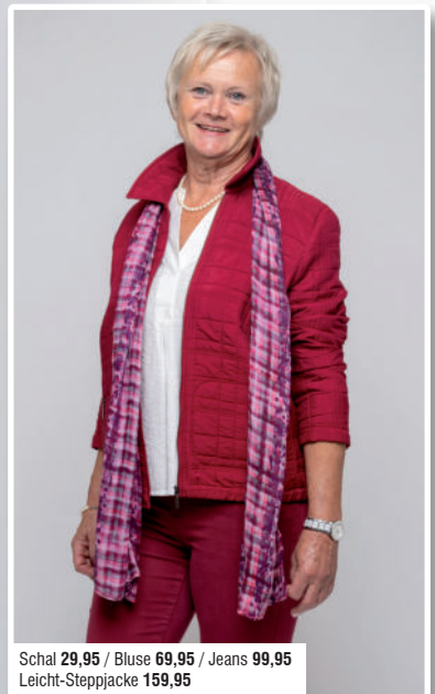
Schal 29,95 / Bluse 69,95 / Jeans 99,95 Leicht-Steppjacke 159,95