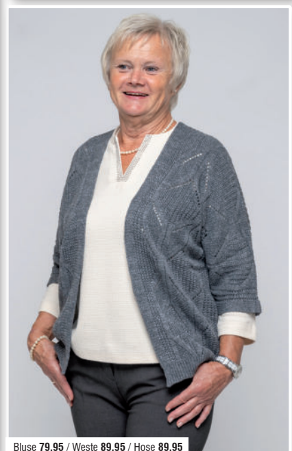
Bluse 79,95 / Weste 89,95 / Hose 89,95