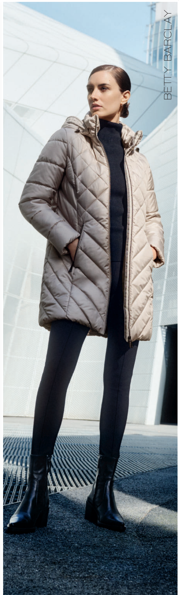
Steppjacke (Kapuze abnehmbar) 179,95