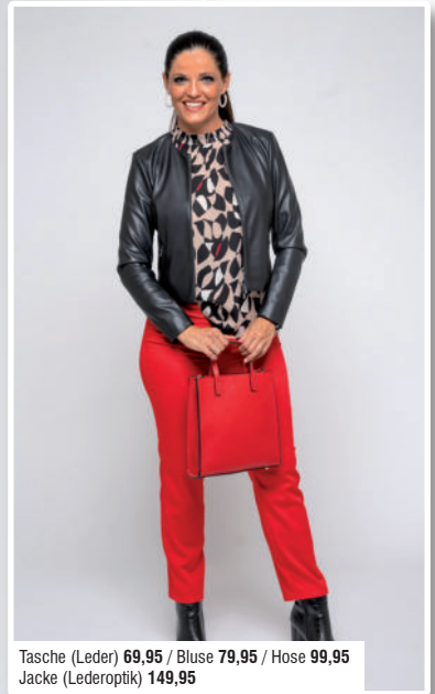
Tasche (Leder) 69,95 / Bluse 79,95 / Hose 99,95 Jacke (Lederoptik) 149,95