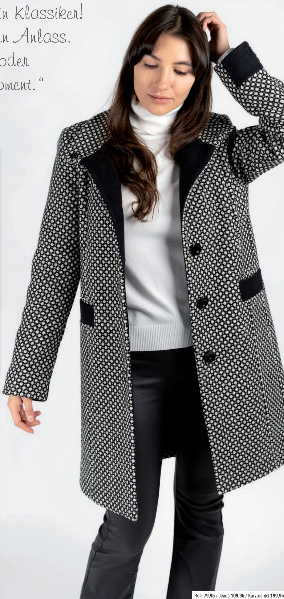
Rolli 79,95 / Jeans 109,95 / Kurzmantel 199,95