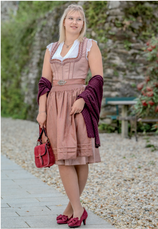
Tasche 49,95 / Di. Bluse (Stretch) 69,90 / Tr. Pumps 89,95 / Dirndl 169,-