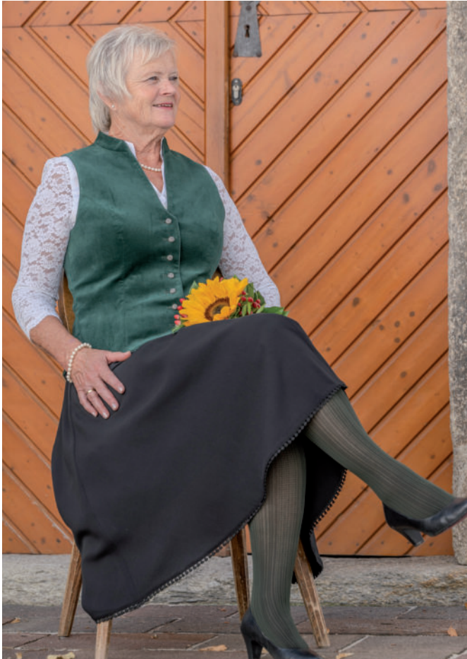
Strumpfhose 17,- / Tr. Bluse 99,90 / Tr. Rock 179,90 / Tr. Gilet (Samt) 209,90