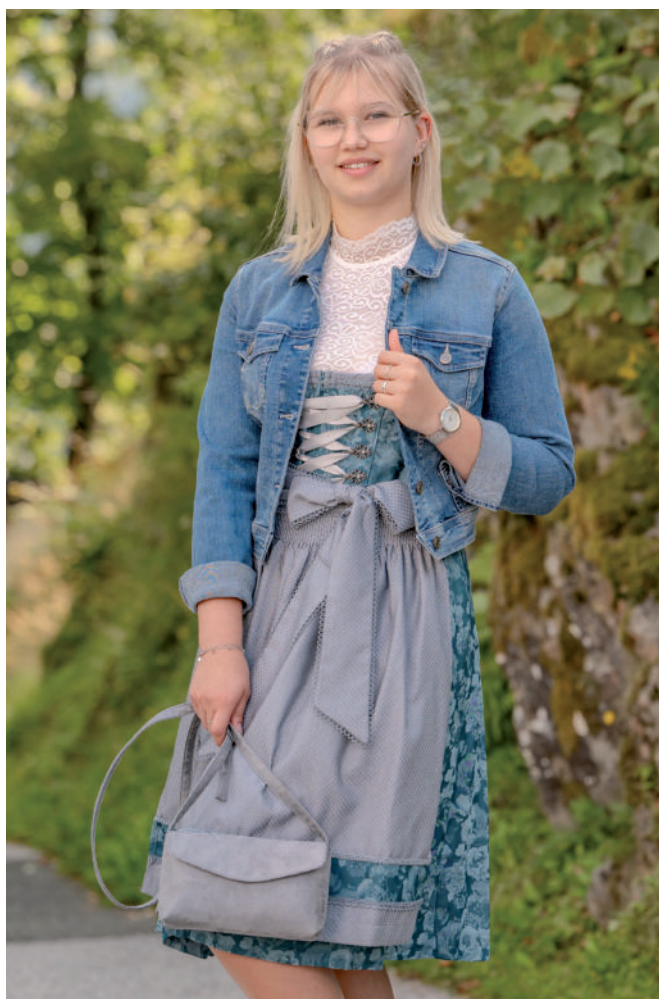
Tasche 49,95 / Di. Bluse 49,90 / Jeans-Jacke 99,95 / Dirndl 189,-