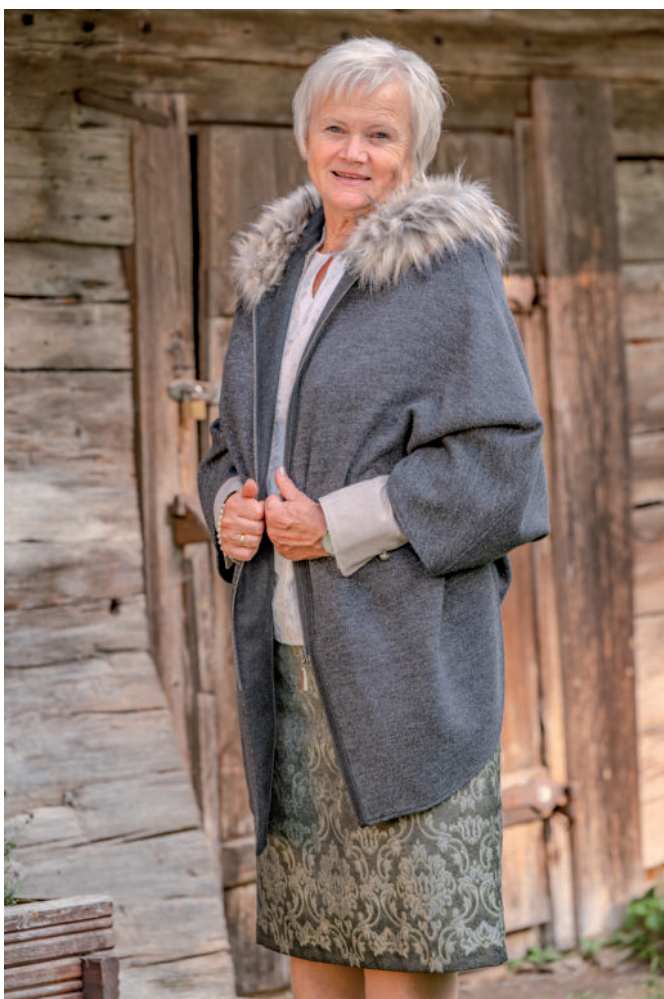
Tr. Bluse 69,90 / Tr. Rock 169,90 / Tr. Cape mit Kunst-Pelz (Jersey) 399,-