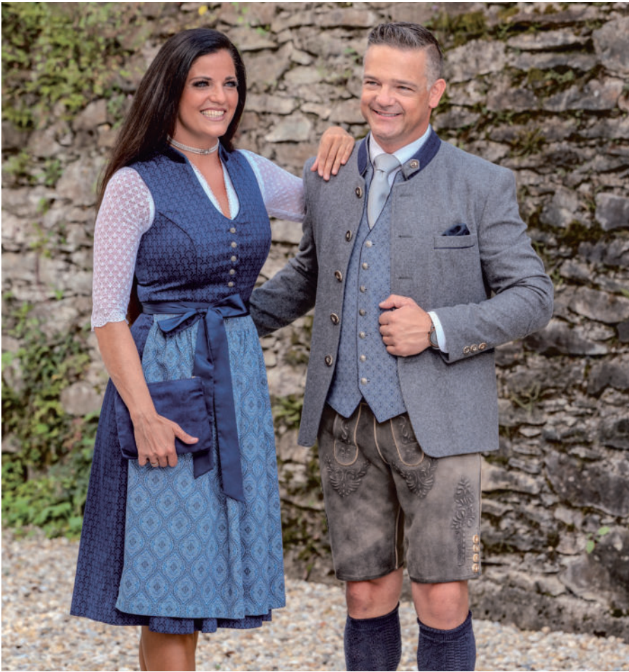
Tasche 49,95 / Di. Bluse (Stretch) 89,90 / Dirndl 289,90